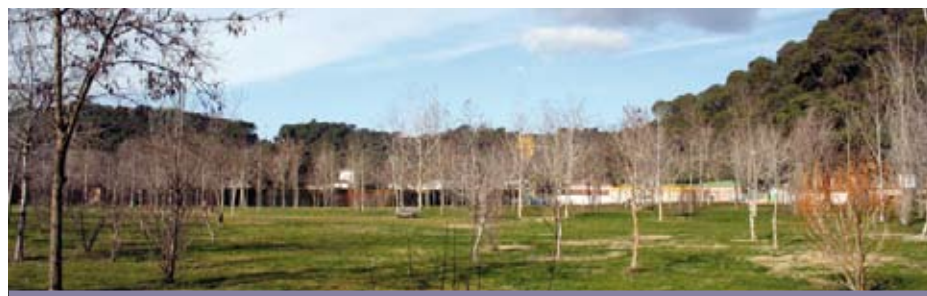
► Parc de sa riera

L'Agenda 21 Local és l'estratègia per assolir un model de desenvolupament sostenible a nivell municipal, amb la finalitat d'abordar els problemes detectats, i definir els programes d'actuació, i les accions concretes encaminades a millorar la qualitat de vida de la ciutadania i la qualitat ambiental del territori.