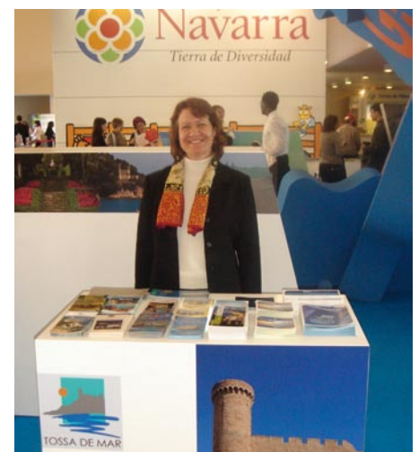
Estand de Tossa a Navatur