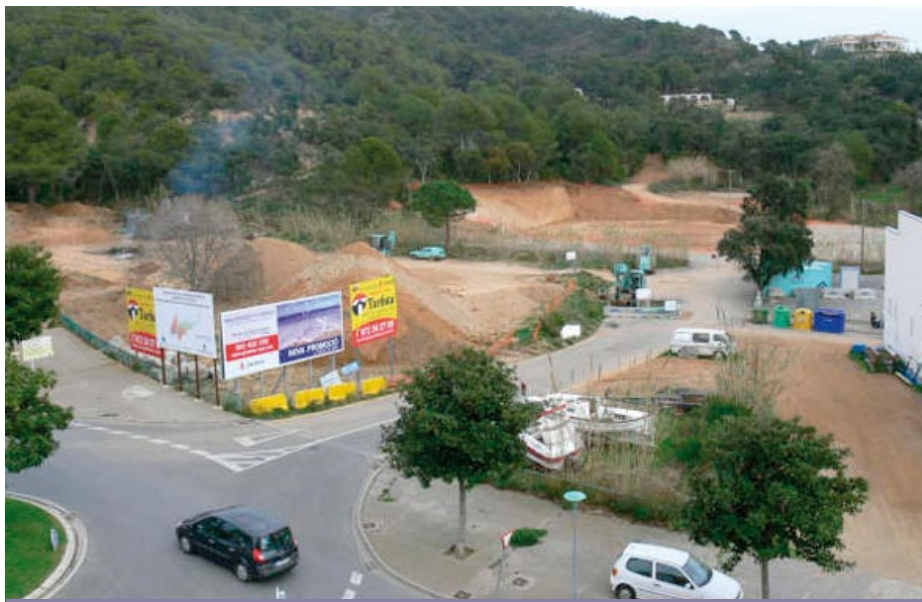
► Solar de la Porta de Sant Feliu on s'hi construeix un nou aparcament.

Tanmateix, segons es va explicar en el darrer Ple del mes de març, des de l'àrea de Governació s'està negociant poder obrir aparcaments aquest estiu en un seguit de